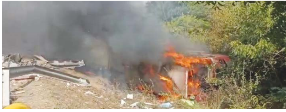
ટેન્કરને બચાવવા જતાં સર્જાયો અકસ્માત : એક બસ પલ્ટી જતાં ભીષણ આગ લાગતા પ્રવાસીઓ ચુપતા ભૂંભ્યા : મૃત્યુઆંક વધવાની દહેશત

અકસ્માત બાદ હાઈવે પર ટ્રાફિક જામ થઈ ગયો હતો. ઘટનાની જાણ થતાં જ સ્થાનિક લોકો અને રાહદારીઓ તાત્કાલિક બચાવ કામગીરી માટે દોડી આવ્યા હતા.