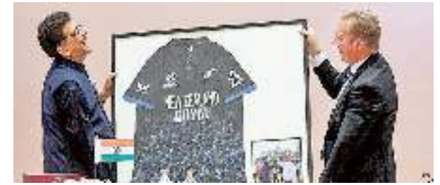
BOLSTERING TIES. Commerce Minister Piyush Goyal being felicitated by New Zealand's Trade and Investment Minister Todd McClay in New Delhi on Monday

Amid deepening global uncertainty, India and New Zealand signed a bilateral free trade agreement (FTA) on Monday, 13 months after negotiations began. The deal grants duty-free access to all Indian goods and increases market access for 95 per cent of New Zealand's exports.