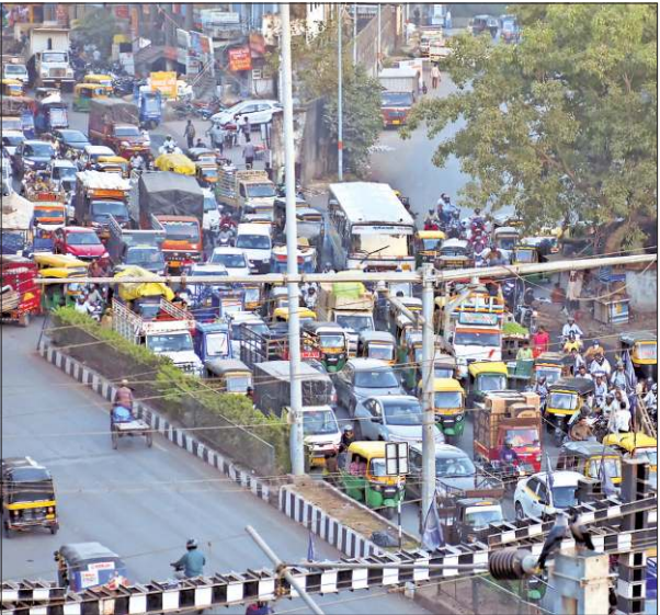
Meetings have been held with diamond bodies to tackle the traffic problem during peak hours. EXPRESS

Majority of cases in diamond and textile hubs, tickets for not wearing helmets rise 60 times