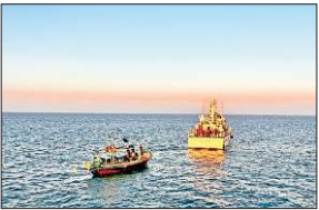
The boats were apprehended in the Indian Exclusive Economic Zone.

The ICG in a post on social media site X, said, "In a swift operation on December 10, the Indian Coast Guard apprehended a Pakistani fishing boat with 11 crew inside the Indian Exclusive Economic Zone (EEZ)." It further said, "This interdiction underscores Bhartiya Tatrakshak's sustained maritime operations and India's commitment to securing its maritime