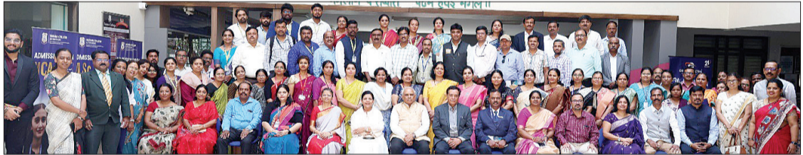
ಕೆಗೆರೆ ಯು ಸುರಾನಾ ಕಾಲೇಜಿನಲ್ಲಿ 'ವಿಕಸಿತ ಭಾರತ 2047 ರ ಗುರಿಯಲ್ಲಿ ಶಿಕ್ಷಣ ಸಂಸ್ಥೆಗಳ ಪಾತ್ರ' ಎಂಬ ಕಾರ್ಯಕ್ರಮವನ್ನು ಹಮ್ಮಿಕೊಳ್ಳಲಾಗಿತ್ತು.

ಬಗ್ಗೆ ರಾಜ್ಯ ಸರ್ಕಾರ ಸುತ್ತೋಲೆ ಹೊರಡಿಸಿದೆಯೇ ಎಂದು ಸರ್ಕಾರಿ ವಲೇಲರನ್ನು ಕೇಳಿದರು. ಸರ್ಕಾರಿ ವಲೇಲರು, ಸದ್ಯಕ್ಕೆ ಕರಡು ಅಧಿ ಸೂಚನೆ ಹೊರಡಿಸಲಾಗಿದೆ. ಹೆಚ್ಚಿನ ಮಾಹಿತಿ ಯನ್ನು ಸರ್ಕಾರದಿಂದ ಪಡೆದು ತಿಳಿಸಲಾಗುವುದು ಎಂದು ತಿಳಿಸಿದರು. ವಾದ-ಪ್ರತಿವಾದ ಅರಿಯದ ನ್ಯಾಯಾಧಿಕಾರಿ, ಹಾಲಿ ಇರುವ ನಿಯಮಗಳು ಹಾಗೂ ಮಾರ್ಗಸೂಚಿಯಂತೆ 2025-2026ನೇ ಸಾಲಿನ ಎನ್‌ಎಸ್ ಎಲ್‌ಸಿ ಪರೀಕ್ಷೆಯಲ್ಲಿ ಒಂದಿ ಸೇರಿದಂತೆ ತೃತೀಯ ಭಾಷಾ ವಿಷಯಗಳಿಗೆ ಗ್ರೇಡ್ ಬದಲಿಗೆ ಅಂಕಗಳನ್ನು ನೀಡುವಂತೆ ರಾಜ್ಯ ಸರ್ಕಾರಕ್ಕೆ ನಿರ್ದೇಶಿಸಿ ಅರ್ಜಿ ಇತ್ಯರ್ಥಪಡಿಸಿದ.